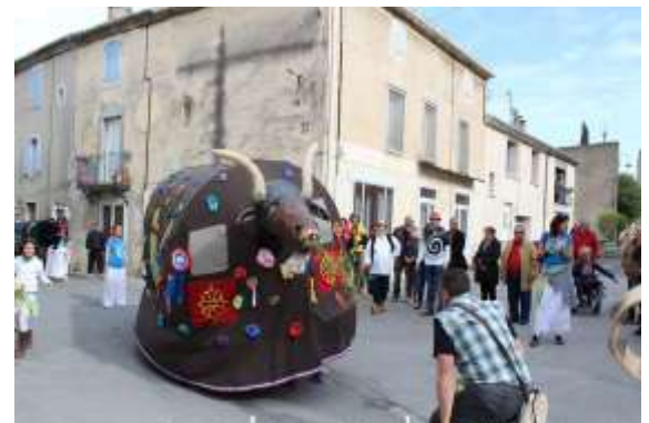
Le Bouc de Paulhan