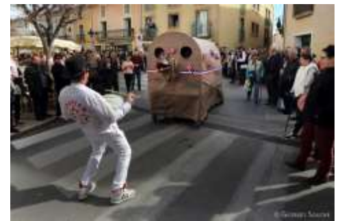
Le Loup de Loupian (Témoïn du Tamarou)