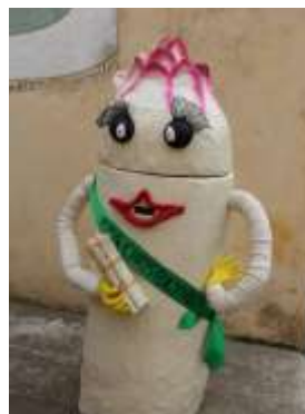
L'asperge de St-Christoly (33) Témoïn de la Baragogne