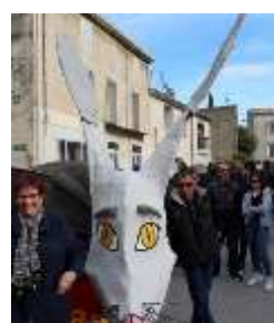
Le Tamarou de Vendargues