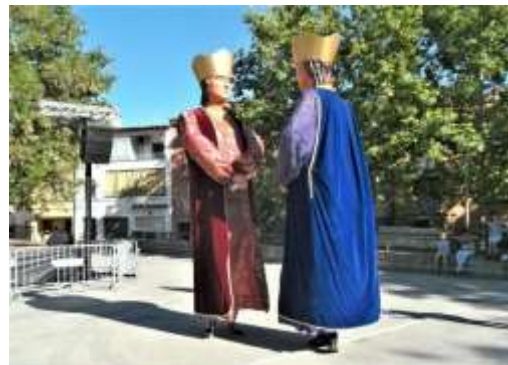
St Côme et St Damien D'Argèles sur Mer