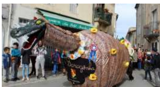
La Baragogne de St-Christol