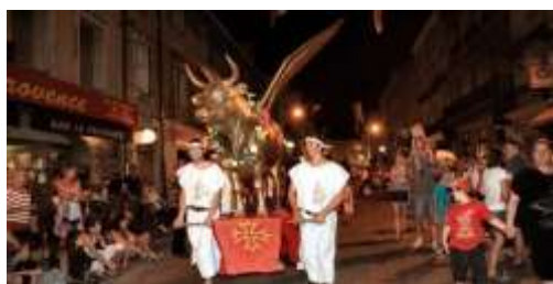
Le Volo Biou de St Ambroix (30) (Témoïn du Tamarou)