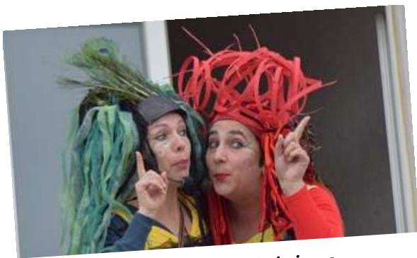
Théâtre des Origines

Les réjouissances se poursuivront tout au long du banquet de mariage !